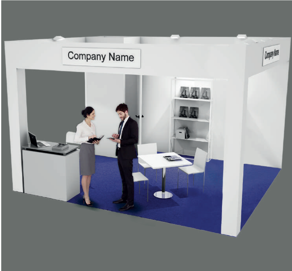
Soluzione 3 lati aperti / Three open sides booth