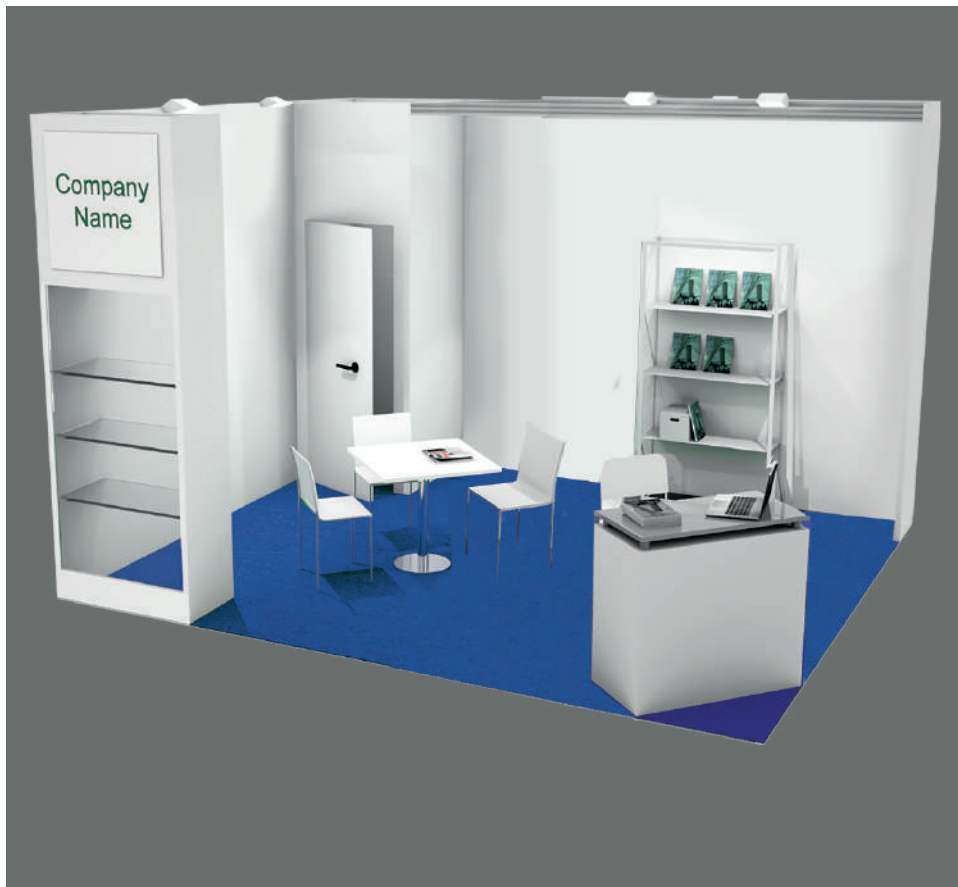
Soluzione 2 lati aperti / Two open sides booth