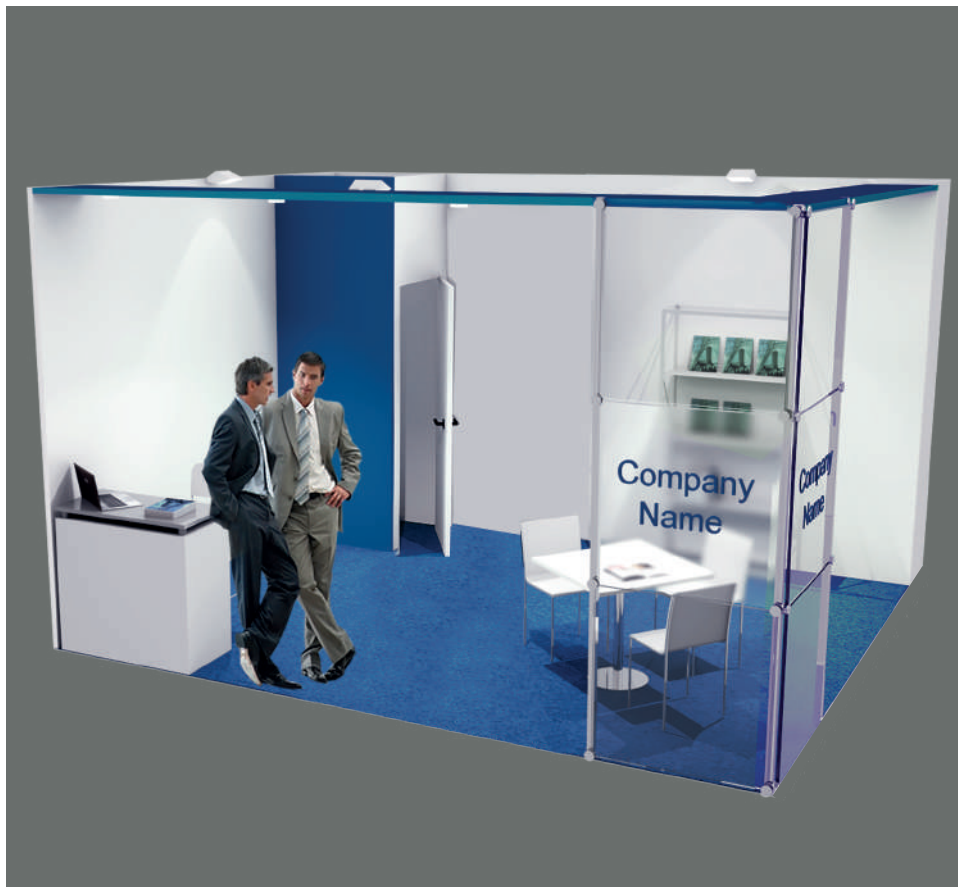
Soluzione 2 lati aperti / Two open sides booth